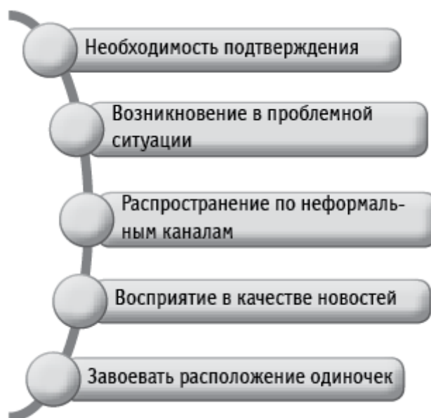
Рисунок 1. Признаки сведений, образующих слух

Таким образом, слухами можно назвать неподтвержденные сообщения, которые распространяются по неформальным каналам общения при возникновении проблемных